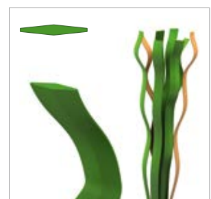
Épaisseur de fibre : env. 120 µm