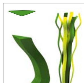
Épaisseur de fibre : env. 250 µm