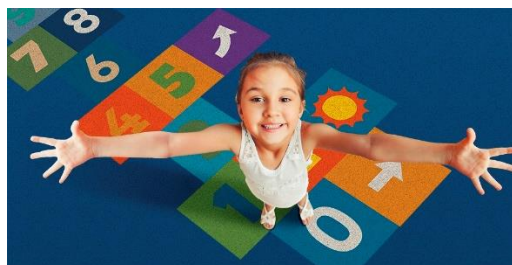
Bodenbilder mit Stylemaker®