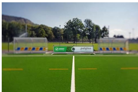
LigaTurf Cross GT zero in Jena